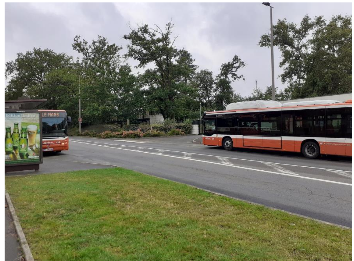
Figure 1 : Desserte actuelle – Ligne 6 – arrêt California – SERUE Ingénierie

Elle reprend dans sa totalité l’itinéraire de la ligne 6 actuelle. Sur une longueur de 9 km entre République et Saint Martin, elle permet la desserte également de nombreux équipements du territoire. La Chronoligne C6 passe également dans une limite communale au niveau de la Rue des Tennis, entre Le Mans et Changé. Son tracé est légèrement modifié par rapport à son tracé initial sur le secteur des Sablons de manière à faciliter sa circulation et la desserte du quartier.